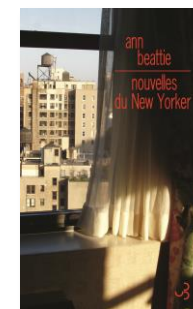
Nouvelles du New Yorker, 2013