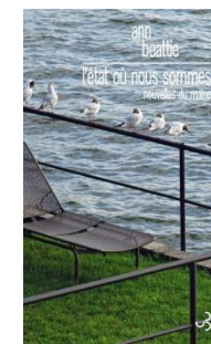
L'État où nous sommes, 2016