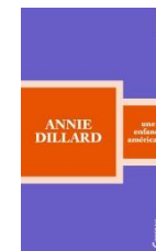
Une enfance américaine, 2017