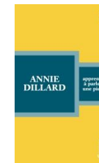
Apprendre à parler à une pierre, 2017