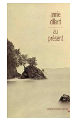
Au présent, 2001