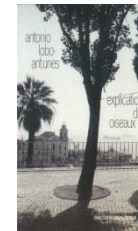
Explication des oiseaux, 1991