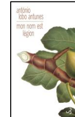
Mon nom est légion, 2011