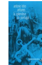
La Splendeur du Portugal, 1998