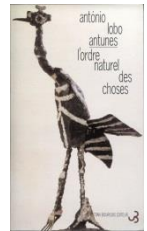
L'Ordre naturel des choses, 2000