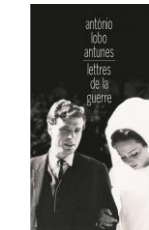
Lettres de la guerre, 2006