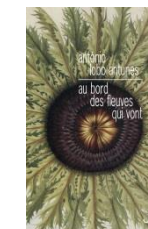
Au bord des fleuves qui vont, 2015