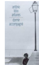
Dormir accompagné, 2001