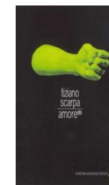
Amore ®, 2000