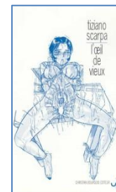
L'Œil de vieux , 2000