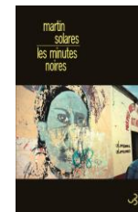
Les Minutes noires , 2009