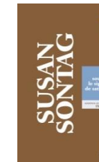
Sous le signe de Saturne, 2013