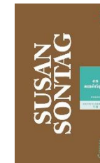
En Amérique, 2011