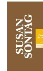
L'Amant du volcan, 2011