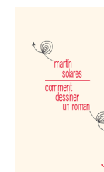
Comment dessiner un roman , 2018