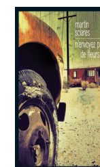
N'envoyez pas de fleurs , 2017